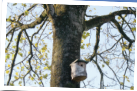
Park tussen ingang Bastion en Rietbaan