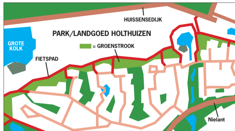
WERKGROEP GROENSTROOK WIJKPLATFORM ZILVERKAMP HOLTHUIZEN

Het Wijkplatform is over deze punten in gesprek met de gemeente. Wilt u op de hoogte blijven van de ontwikkelingen en besluiten rondom de groenstrook? Houd dan de website www.zilverkamphuizen.nl in de gaten.