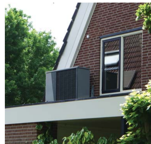
De grote fluisterstille warmtepomp is gemonteerd op de zijgevel van het pand.

Het project 'Nul op de teller' lijkt dus aan de Kuunskop 48 wel te zijn geslaagd! Wie volgt? Bekijk op www.zilverkamphuissen.nl het uitgebreide verhaal, foto's en (technische) gegevens.