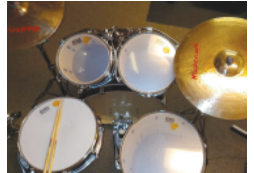
De eerste grote aanschaf voor SilverMusic, een gloednieuw TAMA-drumstel.